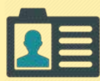
നിങ്ങളുടെ വ്യക്തിഗത വിവരങ്ങൾ നൽകുക